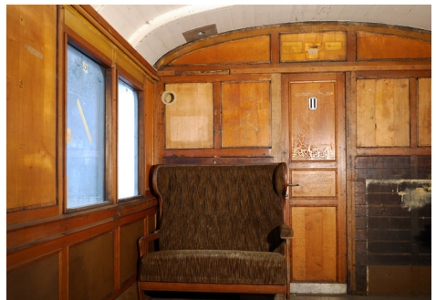
Aktueller Zustand des Raucherabteils mit Musterbank

Den Zeichnungsschein finden Sie auf der Rückseite.