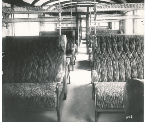
Ablieferungszustand des B 3505 von 1902

Die Finanzierung für die Revision von Laufwerk und Wagenkasten ist bereits sichergestellt, weshalb diese Arbeiten gestartet wurden. Sicherheitsrelevante Arbeiten werden dabei durch eine externe Werkstätte durchgeführt. Die Restaurierung der Innenausstattung erfolgt durch die HEG. Dabei soll die gesamte originale Innenausstattung wie im letzten Betriebszustand von 1915 rekonstruiert werden.