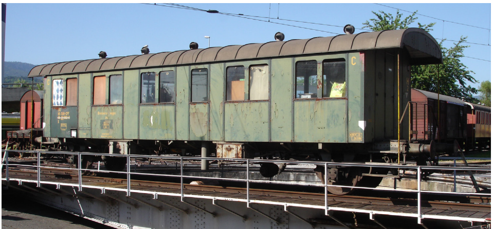
Der B 3505 auf der Drehscheibe in Delémont

1915 erfolgte ein Umbau der Inneneinrichtung, der dem Wagen seine noch heute vorhandene Struktur verlieh. 1962 wurde der B 3505 zu einem Bremsversuchswagen umgebaut, bevor er schliesslich 1976 ausrangiert wurde. Die HEG hat den Wagen 1989 vor dem Abbruch gerettet und seither unter Dach abgestellt.