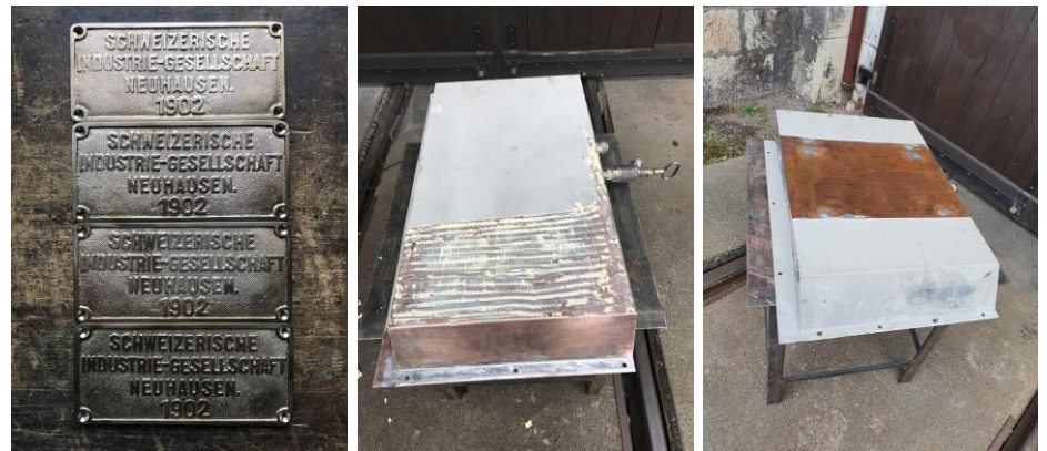
Die nachgegossenen Fabrikschilder erhalten den Feinschliff. Die Wassertanks aus WC und Toilette werden von der alten Farbe befreit.

Nachdem die Arbeiten an den Bankfusswinkeln abgeschlossen waren, haben wir die ersten Teile für die Gepäckträgerstützen angefertigt. Die Winkel für die Wandmontage sind bereit. Um nun aber weiterzuarbeiten benötigen wir die Konsolen der Gepäckträger. Diese werden zurzeit in der Giesserei hergestellt, sobald diese Gussteile eingetroffen sind, können wir an den Gepäckträgern weiterarbeiten. In der Zwischenzeit wurden weitere Teile aufgearbeitet oder sind an der Aufarbeitung, unter anderem die nachgegossenen Fabrikschilder, die Dachlüfter und die Wassertänke für das WC und die Toilette. Nebenbei gibt es auch immer wieder viele administrative Arbeiten zu erledigen, oder Teile und Pläne zu organisieren, damit auch die Arbeiten in Halberstadt weitergehen können.