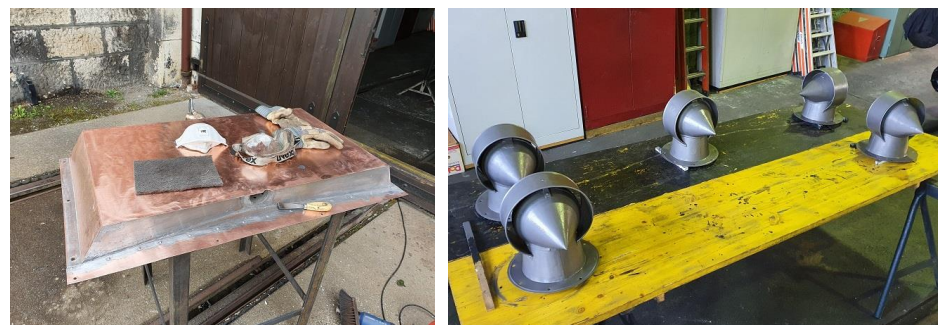
Die Dachlüfter wurden abgeschliffen und neu gestrichen.