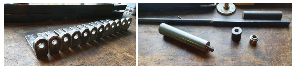
Die Winkel für die Wandmontage der Gepäckträger wurden nachgebaut. Auch ein erstes Muster für die Stange zwischen Stuhl und Dach ist im Bau.