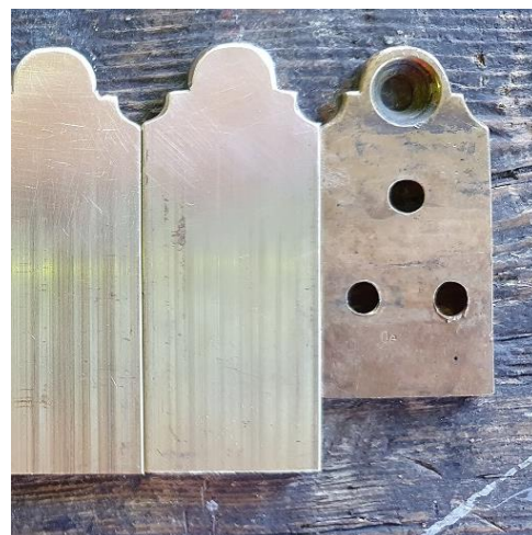
Rekonstruierte Laschen (noch ohne Bohrungen) rechts die Originalvorlage