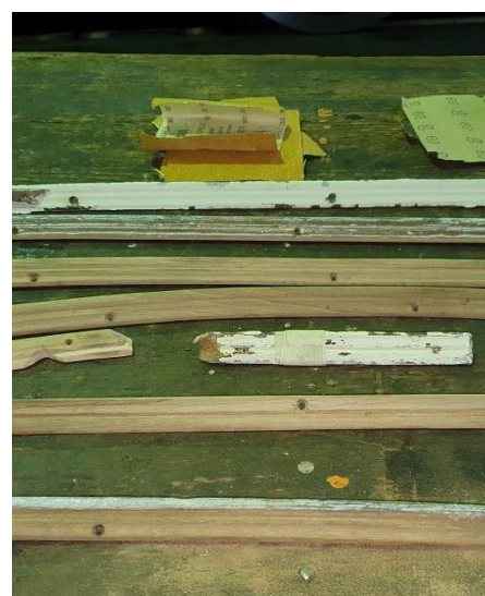
Aufarbeitung der Holzleisten: vor, während und nach Aufarbeitung