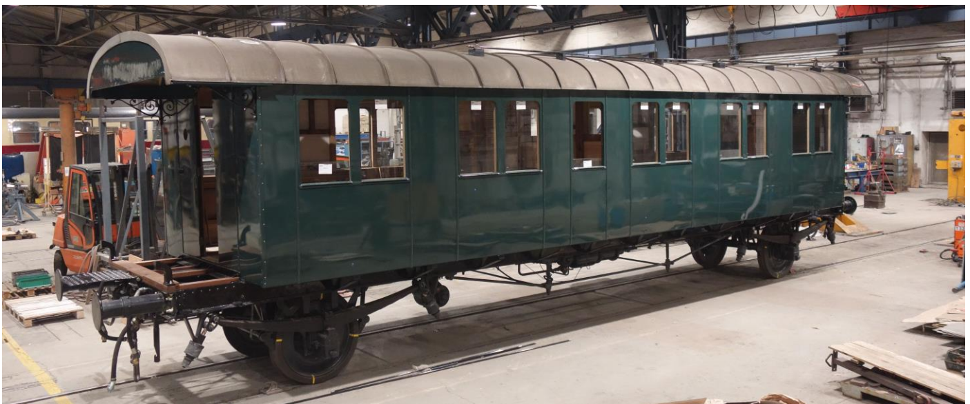
Hochzeit des B 3505 in Halberstadt: Untergestell und Wagenkasten sind wieder vereint (Dezember 2020)