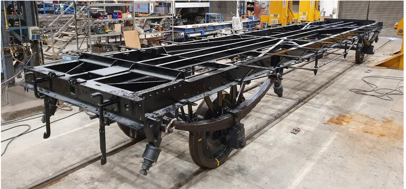
Nicht alltäglicher Anblick des frisch lackierten Untergestells, noch ohne Wagenkasten (Oktober 2020)

Das Untergestell wurde sandgestrahlt, wo nötig repariert, und mit 2-Komponentenfarbe frisch lackiert. Die aufgearbeiteten Komponenten (Laufwerk und Bremsanlage) wurden montiert und der vorgängig neu verblechte und lackierte Wagenkasten wieder auf das Chassis aufgesetzt. Im Wageninnern werden derzeit die letzten Spuren aus der Dienstwagenzeit entfernt und die Fenster samt den neuen Rahmen eingebaut. Im Aussenbereich laufen die Arbeiten zur Rekonstruktion der Plattformen und der Notbremseinrichtung.